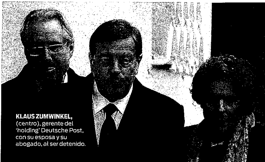
KLAUS ZUMWINKEL , (centro), gerente del 'holding' Deutsche Post, con su esposa y su abogado, al ser detenido.